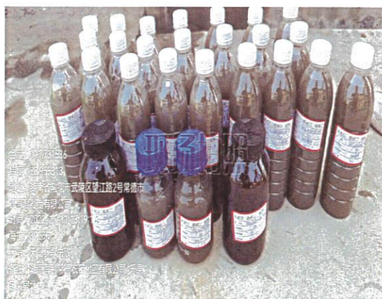
乐果老包装房北样品