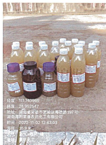
原药包装房西北角样品