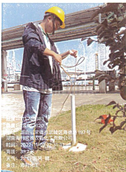
原药包装房西北角